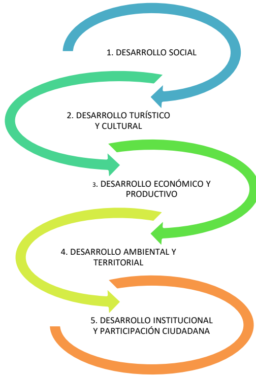
GRÁFICO 1: JERARQUIZACIÓN DE LINEAMIENTOS ESTRATÉGICOS