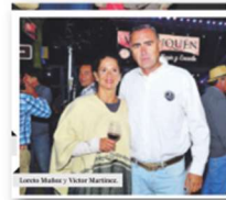
DIARIO LA TERCERA